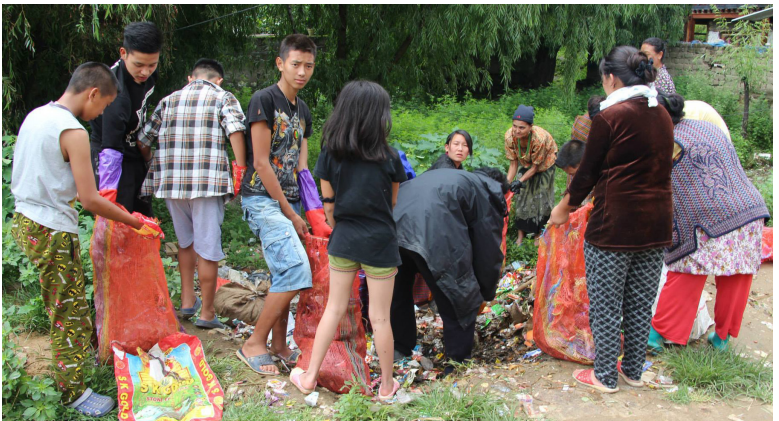
▶ ལྷོ་བ་སྐྱུག་ཚུ་མཉམ་རུབ་ཐོག་ལས་ཕྱག་དར་རྒྱབ་པའི་བསྐྱེད་སྤོང་།

༡ འཕྲུལ་ཁམས་ཅིག་ཁར་ འཁོར་ ལམ་གྱི་ རྟོ་ག་གཅིག་ཐོན་ཡོད་མི་གིས་ ང་ལུ་ འཛོལ་ཐང་ཅན་གྱི་མི་ཁྲུང་ས་ཀྱི་ཡོན་ཏན་ ཐོབ་ནི་ ལུ་ ཕན་ཐོགས་བྱུང་ཡི། ང་གིས་ རྟོ་ག་འདི་ རྟེ་ མ་ལས་ར་ མཐོང་ཡོད་པ་མ་ཚད་ སྐྱུམ་འཁོར་ ལེ་ཤ་ཅིག་ར་ ཕར་རྒྱུར་འབྲོ་ས་ཡང་ མཐོང་ཡི། རེ་ཚེ་སྐབས་ ང་དང་ཚ་རོགས་ཚུ་ འཁོར་ལམ་ འདི་ལ་ལས་ རང་སོའི་དལ་ཉམས་ཅན་གྱི་སྐྱུམ་ འཁོར་ གཏང་འབྲོ་མི་ཚུ་ རྟོ་ག་གྱི་ལྷོད་པ་ཅིག་ གཤོང་གི་རྣམ་འགྲུར་ མ་འདྲུལ་སྟེ་ ལྷོ་མི་ལུ་ བཟུ་སྟེ་ ལྷོ་བ་འབྲུང་ནི་ཡོད། ཁོང་གི་རིན་ཐང་ཚེ་ བའི་སྐྱུམ་འཁོར་ཚུ་ ཟུག་སྐྱོད་དང་བཅས་པ་སྟེ་ རྟོ་ ག་ལུ་རྒྱུང་པའི་སྐབས་ ཚ་གྲུང་དང་བཅས་ བྱང་ འཕྲུགས་སྟེ་ ལེན་མ་དང་གཅིག་ཁར་ མིག་ཏོ་དང་ ལ་མ་རྒྱུ་ཚུ་ཡང་ དུས་སྟེ་འབྲོ་སར་མཐོང་ཡི། ལྷོ་དག་པ་ཅིག་གི་རིང་ ག་ར་ལུ་ བྱ་ སྐབས་མ་བདེ་ཕྱོགས་རྒྱུང་ རྟོ་ག་དེ་བསྐབ་ནིའི་ དོན་ལུ་ མཐོ་བསམ་གཏང་མི་ ག་ཡང་ཐོན་སར་