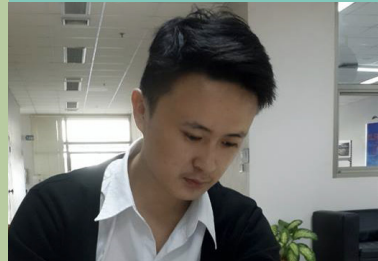
བསོད་ནམས་མཚོ་བརྟེན་ སྒྲོལ་ཕུག་ མོང་སྐྱར།