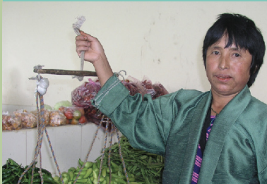
མཚི་མེད་སྒྲོལ་མ་ ༤༩ ཚོད་བསྐྱེད་ཁྲིམ་ ཐུ་པོ།