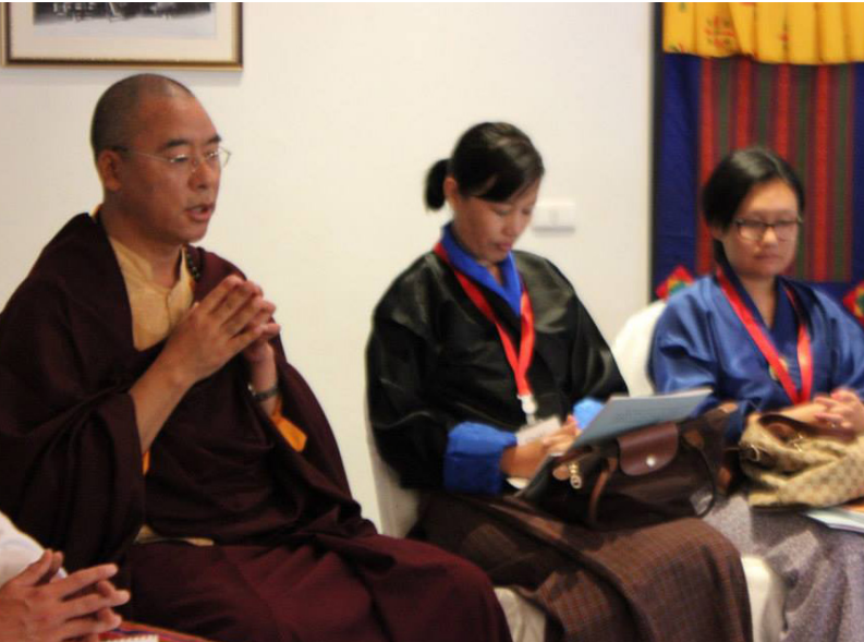
► མཁའ་པོ་སྤྱོད་ཚོགས་བགྲིས་གྱི་གསར་འགྱུར་ལཱ་གི་བསམ་འཆར་བཤད་པའི་བསྐྱེད།

གྲི་བརྒྱུད་དོན་དོན་མ་དང་ སྤང་བདེན་འཕྲོ་བ་ ཚུགས་པ་འབད་ནི་གི་དོན་ལས་ བཟོད་བསྐྱེད་ ཅན་དང་བཙོན་ལྷགས་ ཅན་ཅིག་འོང་དགོ། གནས་ཚུལ་བསྐྱེད་འགོ་དཔེ་ཚུ་ མི་སྤྲེའི་ནང་ གསེ་བཙོན་གྱི་སྐྱེད་བཟུམ་ཅིག་སྤྲེ་ ཞབས་ ཏྲོག་སྐྱེད་མི་ཅིག་ ཨིན་མི་འདི་ཡང་ ཁོང་ གིས་ སྤང་ལེམས་མེད་པ་དང་ གཞོན་པ་ཅན་ གྱི་བྱ་སྤྱོད་ ཆགས་དང་ཕྱོགས་རིས་དང་ བར་ ལྷན་ ཡང་ཅིན་ ཕྱོགས་རིས་སྤྲོད་པའི་ གནས་ཚུལ་ཚུ་ལུ་བརྟེན་ གཞོན་སྤྱོད་ལྷགས་ མི་མ་སྤྱོད་ཚུ་ འོས་འབབ་ལྷན་པའི་ཐབས་ ལམ་ ཡང་ཅིན་ དང་ལེན་ཐབས་ལམ་ཚུ་ འཚོལ་ཞིབ་གྱི་སྤྱོད་ལས་ སྤྲེལ་ཐབས་འབད་མ་ ཨིན།