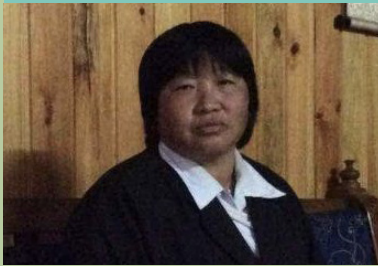
དམ་མཚོ་སྒྲོལ་མ། སྤྱན་གཡོག་མོ་ ལུང་རྟོན་ཕྱག་དམག་སྤྱི་སྤྱོད་ཁང་།