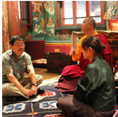
▶ མཁའ་པོ་སྤུན་ཚོགས་བཀའ་ཁྲིམས་དང་ཅིག་ཁར་ སྟོན་རྒྱལ་པའི་ལས་རིམ།

ཚུལ་ གནང་དོན་ག་ཅི་ལུ་བརྟེན་ཏེ་ གནས་ཚུལ་བསྐྱེད་འགོད་པ་གི་ལུ་ གནས་ལ་ རྒྱལ་ཅི། གནས་ཚུལ་བསྐྱེད་འགོད་པ་འབད་ ནི་སྟེ། ཐག་བཅད་མི་དེ་ མིང་གཏམ་དང་ ལུགས་ ཡང་ཅིན་ དབང་ཚད་དང་དབང་ ལུགས་ འཐོབ་ཐབས་ལུ་བཟུ་སྟེ་ཡིན་ན། མི་ སྤེལ་ནང་ལུ་དང་ དམིགས་གསལ་དུ་ འབྲུག་ རྒྱལ་ཁབ་བརྒྱུམ་མའི་ དམངས་གཙོ་རིང་ ལུགས་གསར་པའི་ནང་ གནས་ཚུལ་བསྐྱེད་ བཀོད་པའི་ལུ་འགན་དོམ་ ག་ཅི་ར་ཡིན་མ་ སྟོ། དེ་གི་བསམ་འཆར་ལས་འབད་བ་ཅིན་ གནས་ཚུལ་བསྐྱེད་འགོད་པ་ཟེར་མི་ཚུ་ གོ་ ཤེས་ཉམ་ཤེས་དང་ བཟོད་བསྐྱེད་ཅན་ དེ་ ལས་ ལུགས་པ་དང་བརྟེན་བ་ཡོད་མི་ཅིག་ འོང་དགོཔ་འདྲུག་ཟེར་མཐོམ་མས། གནས་ ཚུལ་བསྐྱེད་འགོད་པ་ཚུ་ ཁོང་གིས་ རང་