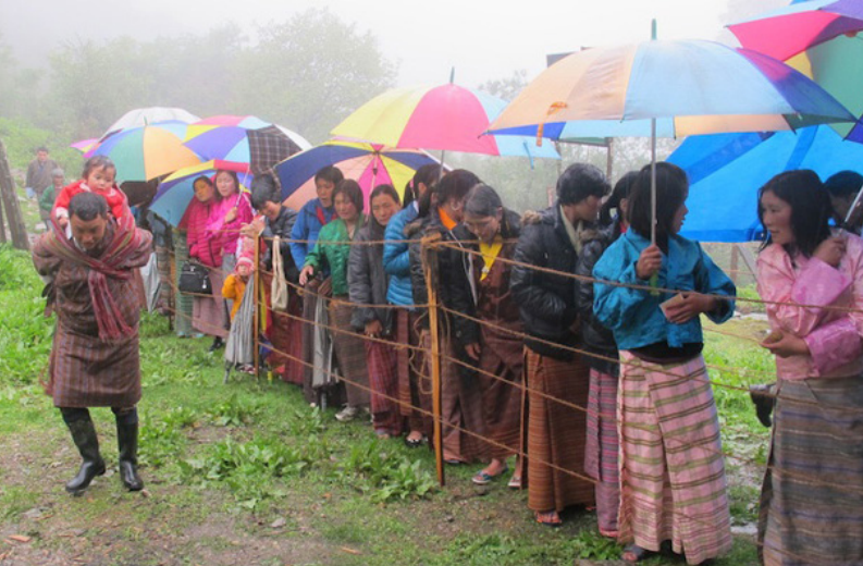
▶ མི་ལེས་ཚུ་སྤྱི་ལོ་ ༢༠༡༣ ལོའི་བཅག་འབྲུལ་ལས་རིམ།

ངགིས་འབད་བ་ཅིན་ འགོ་བཟུང་ འཕེལ་འགྱུར་གྱི་རིམ་པ་ནང་ ཕོ་མོ་གཉིས་ ཆར་ལུ་ འགན་ཁུར་འདྲ་མཉམ་ཡོད་ཟེར་ མནོམ་མས། འདི་ཡང་ ཕོ་སྤྱི་ཚུ་གིས་ འག་ བདའ་ནི་དང་ ལག་ཆ་བཟོ་ནི་ ཉེན་སྦྱོར་ སོགས་གྱི་འགན་ཁུར་འབག་དོ་ཡོད་པ་ད་ མོ་ ཚུ་གིས་ ཨ་ལོ་གསོ་སྦྱོར་ བཞེས་སྦྱོར་འབད་ནི་ ཕྱགས་བརྗེས་ལུ་ བཟའ་ཚང་བདག་ འཛིན་འཐབ་ནིའི་འགན་ཁུར་ཚུ་ འབག་པ་